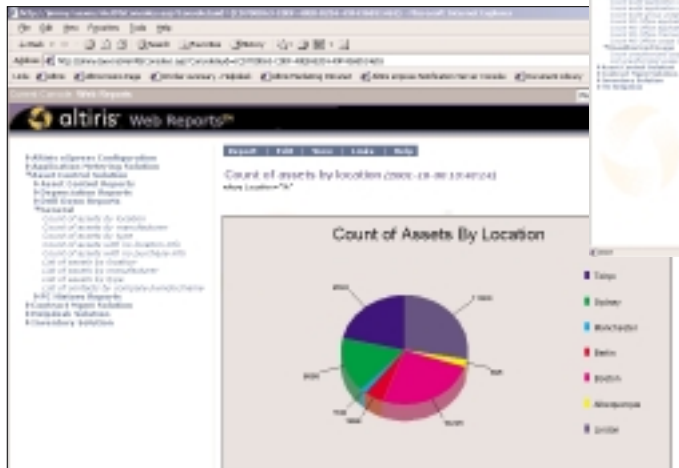
Un informe de Web de Asset Mgmt Suite que muestra un recuento de activos organizados por ubicación.